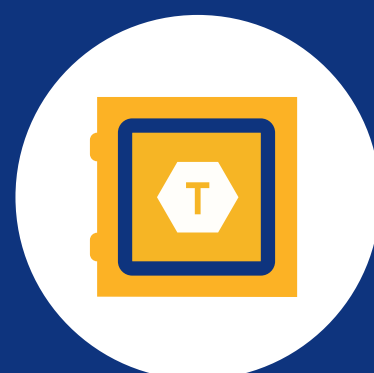
Servicio de Token de Visa

Los Proveedores de Servicio de Token (TSP) son empresas que cumplen con los requisitos de Visa para actuar como terceros y expandir el acceso al Servicio de Token de Visa en todo el mundo proporcionando productos, servicios y soluciones a los emisores y solicitantes de token.