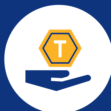
Proveedor de Servicio de Token